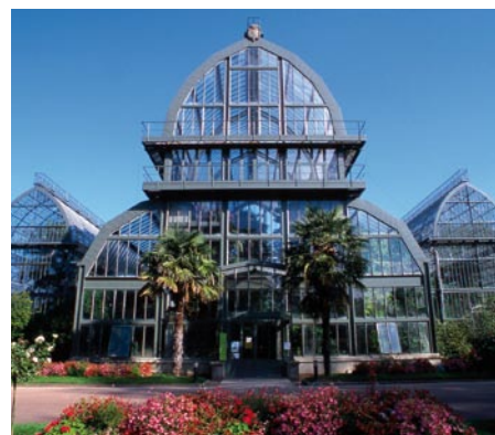
Les Grandes Serres.

La diversification des publics accueillis et leur sensibilisation aux enjeux de conservation du patrimoine naturel, de développement durable, reste à ce jour une des priorités de cette structure publique lyonnaise.